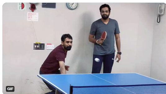
9:00 AM · Jan 25, 2022 · Twitter Web App

Seafarers do vital work but are still impacted by government's Covid-19 travel restrictions. Yet world leaders let sports stars hop from country to country to do their jobs. This is not fair. So today, seafarers are asking #DoesTableTennisCount? @AustralianOpen @Beijing2022