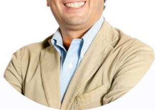
David Parenzo giornalista

con il quale Confitarma ha deciso di lanciare un nuovo ambizioso progetto.