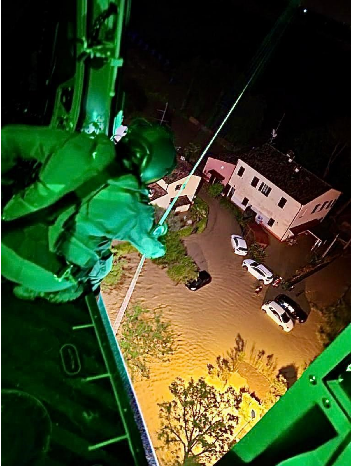
Emilia Romagna, 19 maggio 2023

Un elicottero rischierato presso l'area colpita dall'alluvione, 3 elicotteri pronti ad intervenire, 21 operatori del Gruppo Operativo Subacquei (GOS) del Raggruppamento Subacquei ed Incursori (COMSUBIN), 30 Fucilieri della Brigata Marina San Marco, 10 natanti, circa 15 mezzi di trasporto, tende da campo, questi i mezzi e il personale messo in campo dalla Marina Militare nelle operazioni di soccorso, come richiesto dal Comando Operativo di Vertice Interforze (COVI) su disposizione del Ministro della Difesa Guido Crosetto.