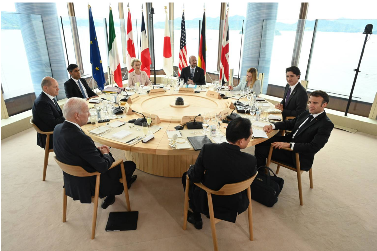
Hiroshima (Giappone), 19 maggio 2023