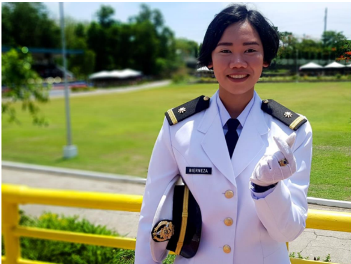
Manila (Filippine), 16 maggio 2023

Le Filippine e l'Indonesia, che forniscono poco meno del 21% degli equipaggi del mondo, stanno agendo per sostenere i loro marittimi nell'aggiornamento delle competenze necessarie nell'ambito della decarbonizzazione. I costanti progressi delle principali nazioni di provenienza dei marittimi asiatici, come Filippine e Indonesia, per dotare i loro lavoratori delle competenze necessarie per fornire un settore a basse e zero emissioni di carbonio, saranno presentati al " Seizing opportunities for green shipping in Asia e nel Pacifico ", organizzato dall'autorità dell'industria marittima delle Filippine (MARINA). La conferenza mira a esplorare le sfide e le opportunità della decarbonizzazione del trasporto marittimo, compreso lo sviluppo delle competenze per i marittimi e una giusta transizione. Un'azione tempestiva da parte dei governi e delle autorità per migliorare la formazione e le competenze consentirà ai loro cittadini di cogliere le opportunità di lavoro di alta qualità create dalla transizione verde del trasporto marittimo. Un recente studio di DNV ha stimato che 800.000 marittimi avranno bisogno di ulteriore formazione entro la metà degli anni '30 per gestire i carburanti, le tecnologie e le navi del futuro.