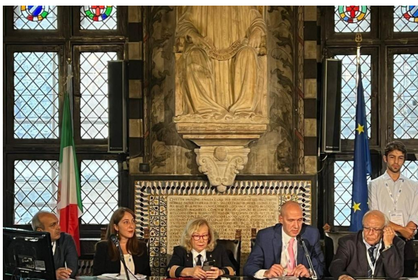
Genova, 11 ottobre 2023