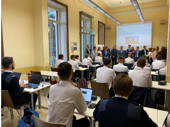
Genova, 12 ottobre 2023