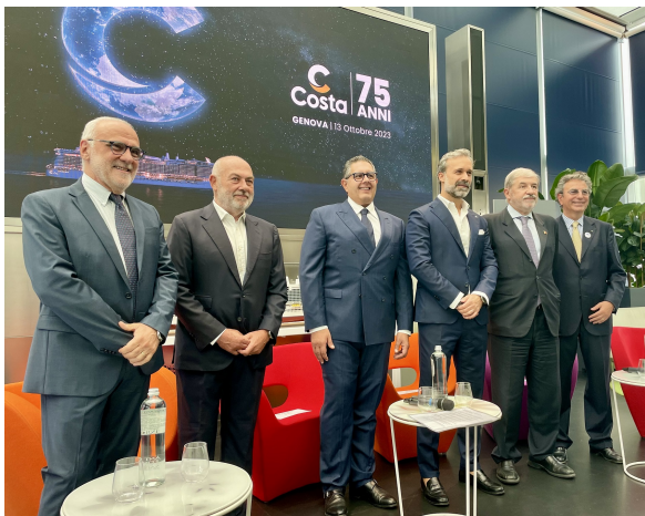
Genova, 13 ottobre 2023

Costa Crociere festeggerà il suo 75° anniversario con una serie di eventi in programma dal 19 al 27 ottobre a Genova , la città dove nel 1948 è iniziata la storia della compagnia, con il viaggio inaugurale della “Anna C”, la prima nave passeggeri della flotta. La sera di venerdì 20 ottobre Costa offrirà alla città uno show mai visto prima in Italia: il Monumental Tour. L'appuntamento, aperto a tutti, è alle ore 20.45 in piazza Matteotti , per uno spettacolo che unisce musica elettronica, patrimonio culturale e digital art, creato dal DJ e produttore francese Michael Canitrot [...].