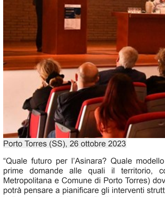
Genova, 25 ottobre 2023

Il programma di appuntamenti dell'assemblea dei comuni italiani prevede un incontro dedicato ai Guardiani della Costa, il progetto nazionale di educazione ambientale e "citizen science" promosso da Costa Crociere Foundation, che permette alle scuole italiane di "adottare" un tratto di costa. Il progetto ha coinvolto finora oltre 70.000 studenti; ancora aperte le iscrizioni per l'edizione 2023/24. Nell'ambito dei festeggiamenti per il suo 75° anniversario, Costa Crociere è brand sponsor della 40° Assemblea Annuale dell'Anci, l'Associazione Nazionale dei Comuni Italiani, che si tiene presso il Padiglione Blu della Fiera di Genova dal 24 al 26 ottobre. Durante questo importante evento, la compagnia italiana ha organizzato un workshop dedicato ai Guardiani della Costa, il progetto nazionale di educazione ambientale e "citizen science" promosso da Costa Crociere Foundation, rivolto alle scuole italiane.[...]. VAI ALLA NOTIZIA