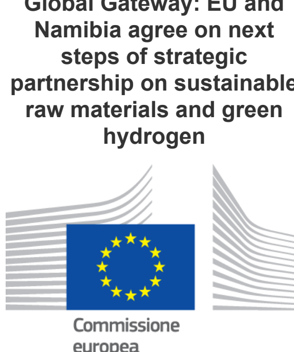
Roma, 26 ottobre 2023

Si è svolta a Roma la Terza sessione del tavolo Energia Italia-Albania, con l'obiettivo di intensificare la collaborazione tra i due stati nei comuni obiettivi di sicurezza e transizione energetica. I lavori, svolti a Roma presso il Ministero dell'Ambiente e della Sicurezza Energetica, sono stati aperti dal ministro italiano Gilberto Pichetto Fratin e dalla Vice Prima Ministra e Ministra delle Infrastrutture e dell'Energia albanese, Belinda Balluku. Ai lavori hanno partecipato esponenti dei principali attori del settore energetico dei due paesi, tra i quali i due regolatori, i due gestori del mercato elettrico, il GSE, i gestori delle reti di trasporto di gas e gas e gas e naturale imprese e associazioni di imprese. VAI ALLA NOTIZIA