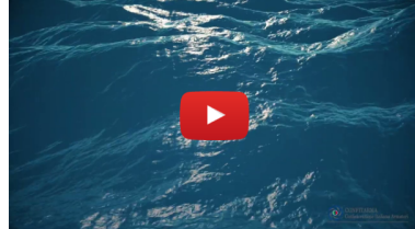
Clip video promo