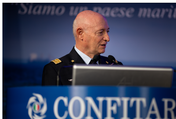
Capo di Stato Maggiore dell'Aeronautica Gen. Sq. Aerea