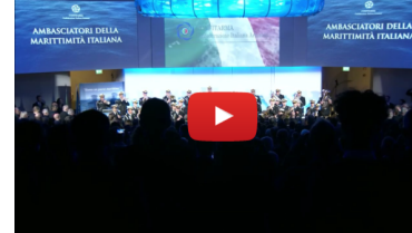
Clip video Banda Musicale della Marina Militare