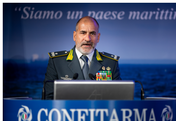
Comandante del Centro Navale di Formia della Guardia di Finanza Gen.