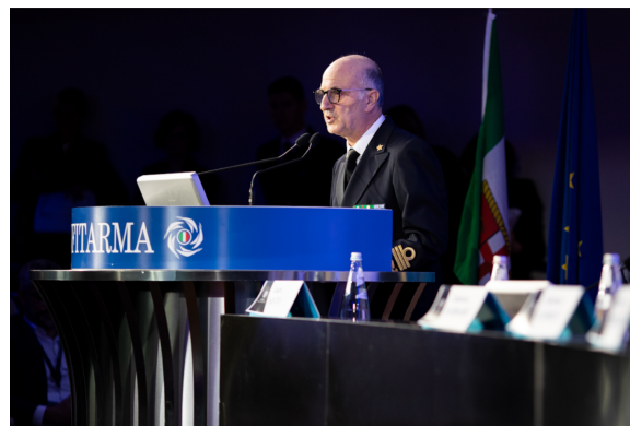
Comandante Generale Corpo Capitanerie di Porto, Guardia Costiera Amm. Isp. Capo (CP)