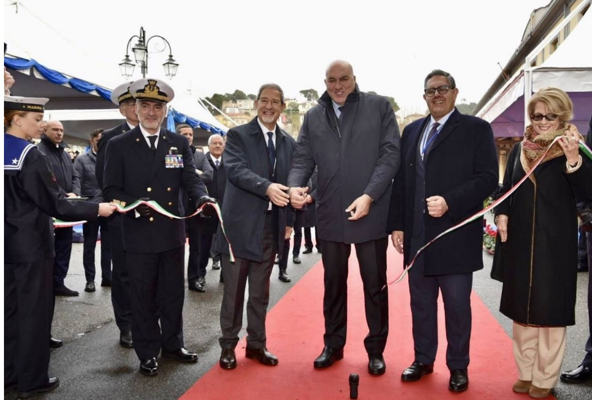
La Spezia, 12 dicembre 2023

Confitarma ha partecipato all'inaugurazione del Polo Nazionale della Dimensione Subacquea a La Spezia. L'evento, che ha visto la partecipazione di numerose autorità civili e militari, segna l'inizio di un nuovo percorso. Il Polo Nazionale della Dimensione Subacquea nasce come risposta del Sistema Paese per promuovere, facilitare e coordinare la cooperazione delle diverse eccellenze nazionali nel settore, in chiave sinergica.