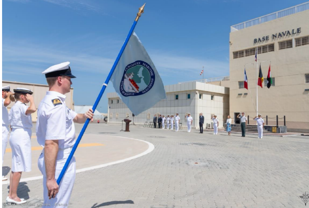
Abu Dhabi (UAE), 8 marzo 2024