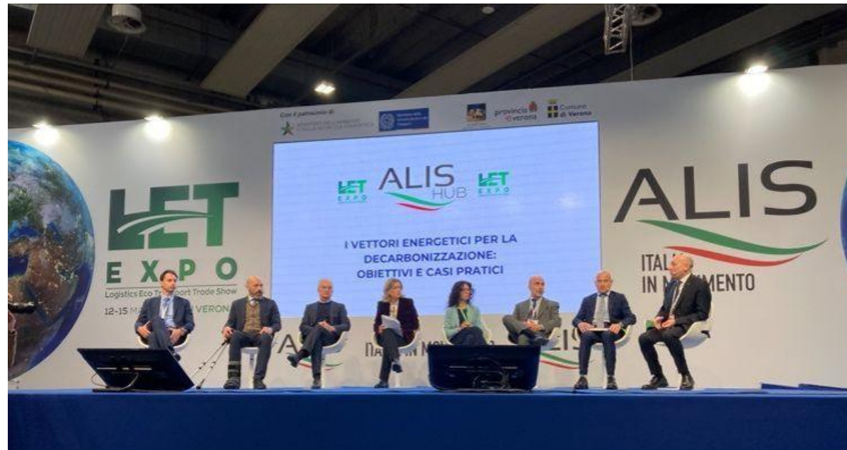
Verona, 14 marzo 2024