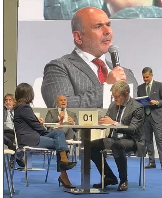
Verona, 14 marzo 2024