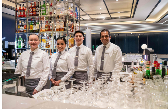
Genova, 16 aprile 2024

Quindici posti a disposizione per formare gratuitamente nuovi barman che andranno a lavorare a bordo delle navi Costa Crociere.