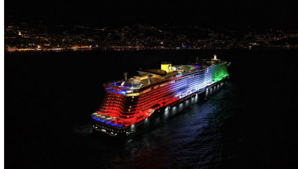
Genova, 15 aprile 2024

La compagnia italiana partecipa all’iniziativa istituita dal Ministero delle Imprese e del Made in Italy per promuovere la creatività e l’eccellenza italiana.