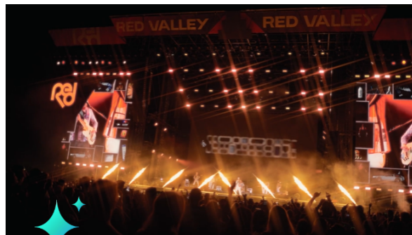
Napoli, 22 aprile 2024

Torna il Red Valley Festival , il grande evento crossover di musica pop, urban, rap e dance nato nel 2015 ed in programma ad Olbia dal 14 al 17 agosto 2024, con i suoi 4 giorni di concerti