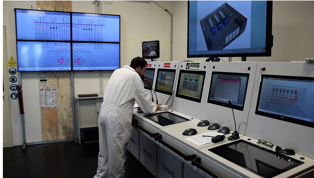
Napoli, 24 aprile 2024