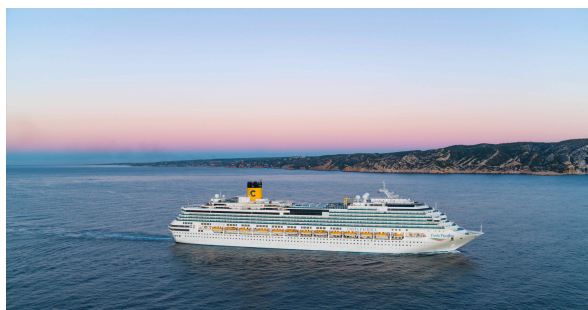
Genova, 14 maggio 2024

Saipem si è aggiudicata un nuovo contratto offshore da Azule Energy per il progetto Ndungu Field in Angola per un valore di circa 850 milioni di dollari