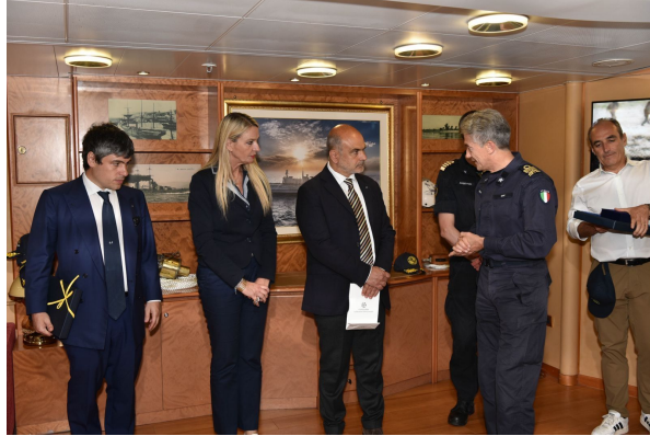
Civitavecchia, 14 maggio 2024