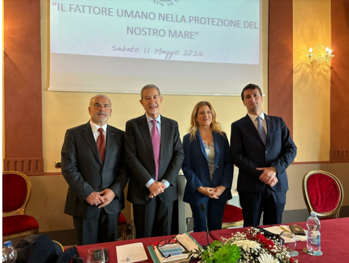
Roma, 11 maggio 2024