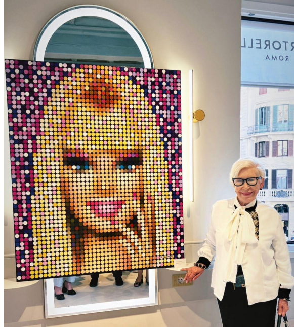
Roma, 24 giugno 2024