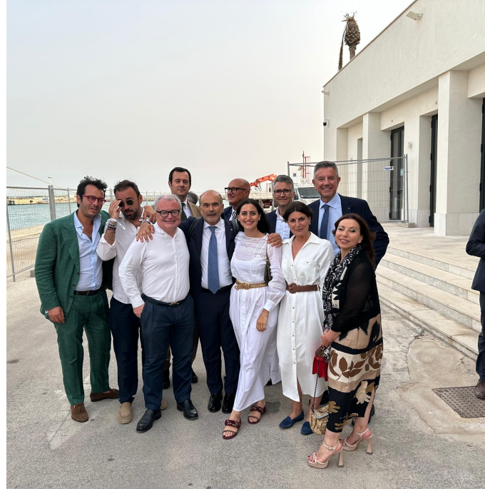
Trapani, 27 giugno 2024

Presentata alla Stazione Marittima di Trapani, la " Vittorio Morace " che si unisce alla flotta di Liberty Lines come una pioniera nel settore del trasporto marittimo sostenibile. Questa innovativa unità lunga 39,5 metri può trasportare fino a 251 passeggeri, muovendosi in modalità totalmente elettrica all'interno dei porti e ricaricando le batterie durante la navigazione in mare aperto. La nave è il risultato di una collaborazione nata nel 2022 tra gli uffici tecnici di Liberty Lines, il cantiere spagnolo Astilleros Armon, il produttore tedesco di motori Rolls-Royce Solutions, Rina e il designer australiano Incat Crowther (fonte LinkedIn Liberty Lines).