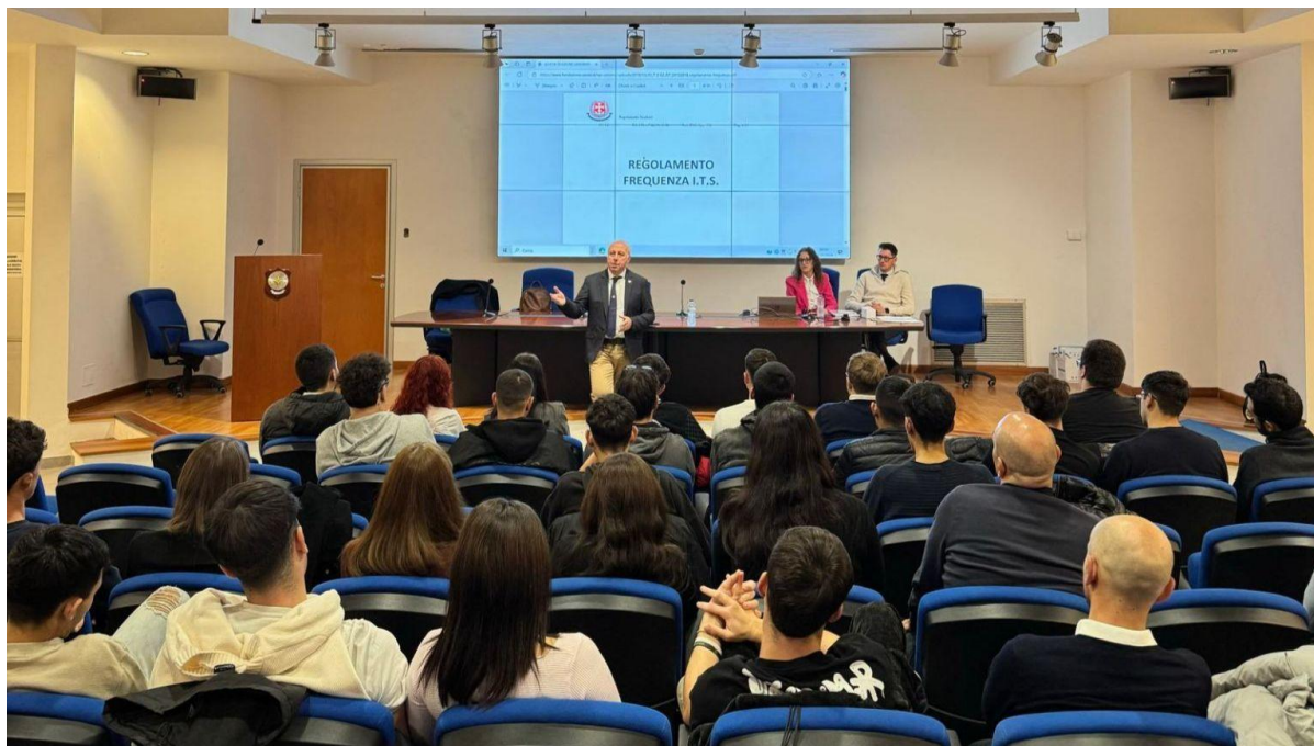
Gaeta, 18 novembre 2024

L'ITS Academy G. Caboto, in collaborazione con l'Autorità di Sistema Portuale del Mar Centro Settentrionale e l'Escola Europea Intermodal Transport, arricchisce la propria offerta formativa con il nuovo corso "Transport and Logistics Planner", progettato per preparare figure altamente qualificate capaci di operare in ruoli chiave all'interno di aziende specializzate nella logistica. Accanto al consolidato corso "Gestione della Logistica Integrata e dei Processi di Spedizione" – giunto alla quinta edizione e arricchito dalla partnership con Arcese Trasporti S.p.A. – l'Istituto potenzia le opportunità per gli studenti grazie a docenti esperti e collaborazioni strategiche con imprese leader. Da evidenziare anche il significativo incremento della partecipazione femminile, che oggi rappresenta il 50% del totale degli iscritti.