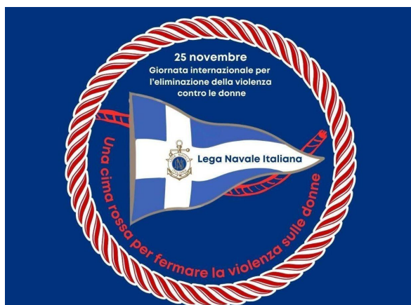
Bari, 22 novembre