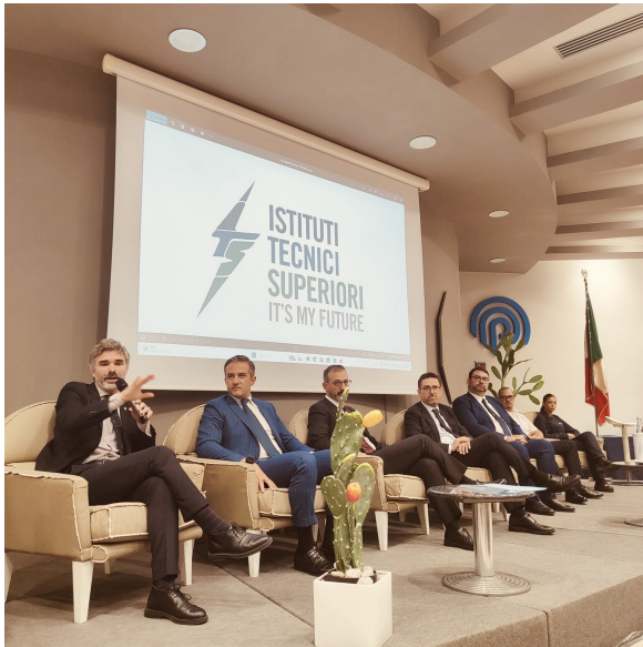
Catania, 20 novembre 2024