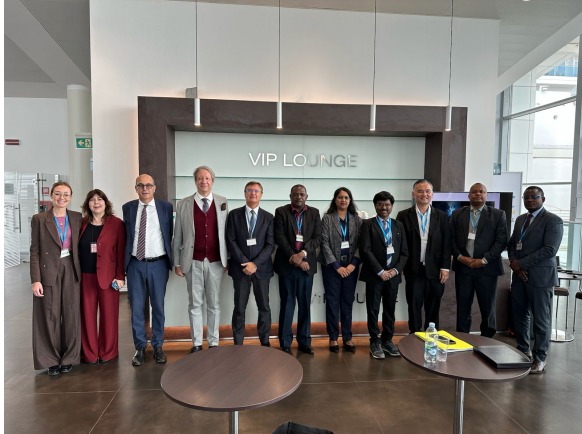
Gaeta, Novembre 11-15