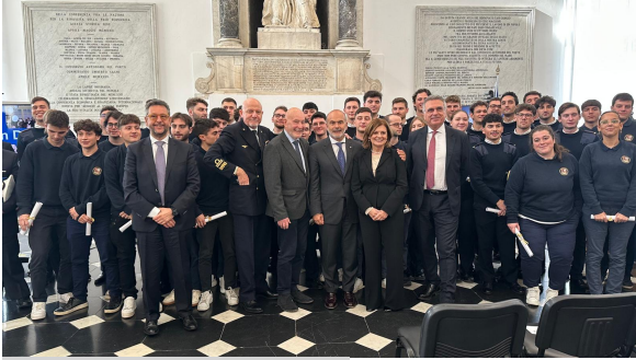
Roma, 19 novembre 2024