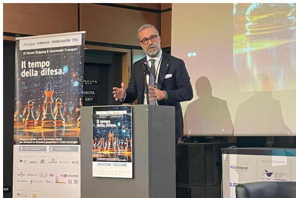
Genova, 5 dicembre