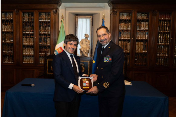
Roma, 12 dicembre