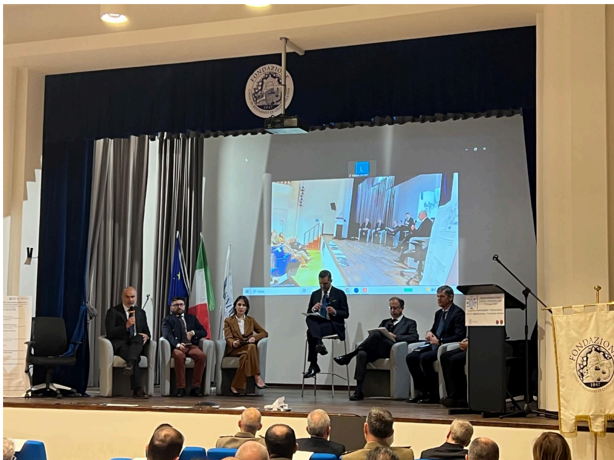
Civitavecchia, 17 gennaio