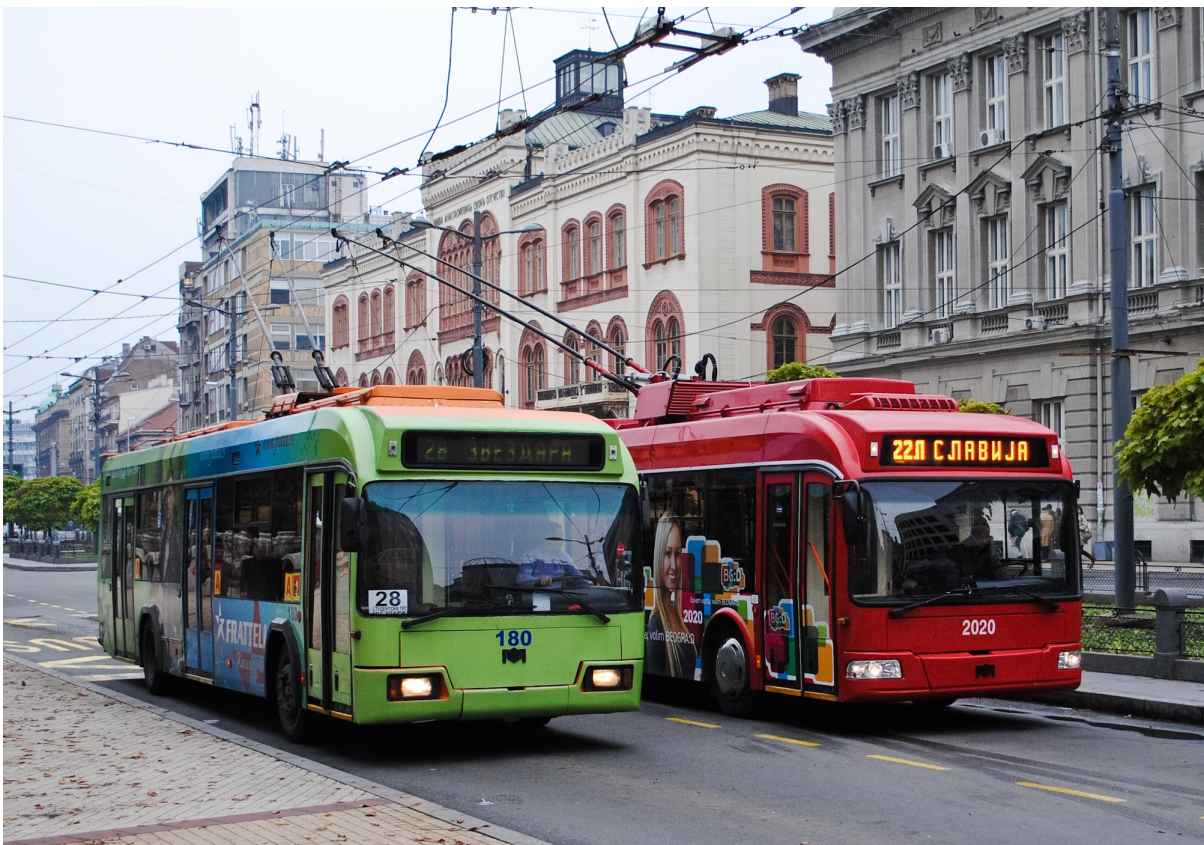
Belgrade, 1 January 2025

Belgrade, Serbia's (RS) capital city, introduced free public transport for all its residents. With a population of 1.7 million, it has become the largest European city to adopt such a policy. Mayor Aleksandar Šapić announced that passengers would no longer need to purchase tickets for buses, trams, or trolleybuses, joining cities such as Luxembourg, Tallinn, and Montpellier in embracing free public transport.