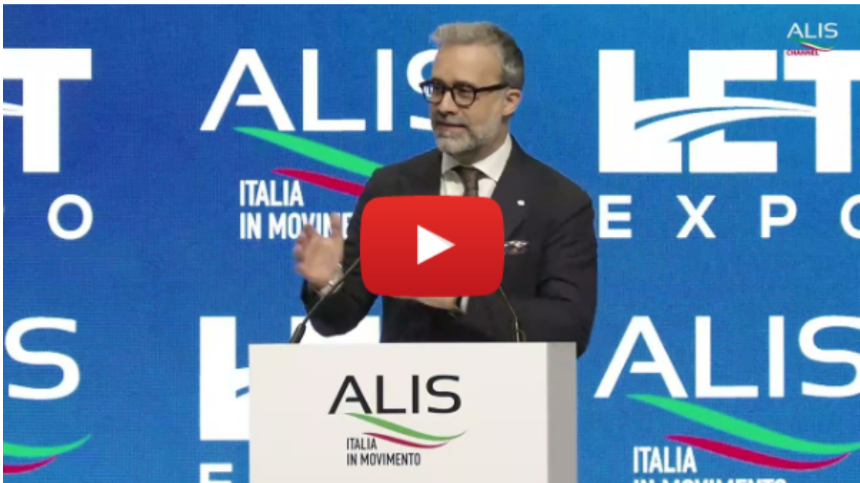
Verona, 13 marzo

"Grazie alla delega del presidente Orsini alla Blue Economy e all'opportunità che il governo ha offerto con la nomina di un Ministro del Mare, in Confindustria abbiamo avviato un percorso sinergico che mira a un nuovo approccio di politica industriale strutturato su tre driver strategici: vettori e flotte, persone e competenze, infrastrutture e portualità. Serve un piano di investimenti per l'ammodernamento delle flotte, favorire l'adozione di tecnologie sostenibili e semplificazioni mirate per rendere la nostra bandiera competitiva, nonché sostenere il sea modal shift, spostando traffico su gomma dalla strada al mare [...]"