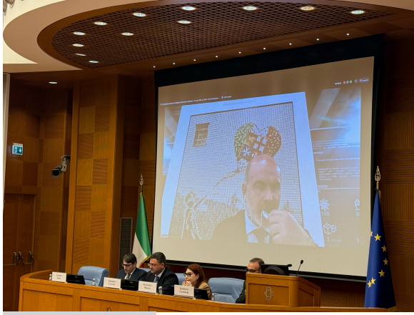
Roma, 13 marzo

Il Direttore Generale ha colto l'occasione per rinnovare l'apprezzamento a tutte le istituzioni presenti, al Ministro Musumeci, al suo Capo di Gabinetto, al Dipartimento e alla Struttura per le Politiche del Mare per il percorso che ha visto tutto il cluster marittimo unito prima nella redazione del Piano del Mare e oggi nel suo aggiornamento. Il Direttore ha sottolineato l'importanza di mantenere il medesimo approccio condiviso di fronte alle importanti sfide che il settore sta affrontando e dovrà affrontare nel prossimo futuro, dalla decarbonizzazione - ETS e FuelEu in primis – alla semplificazione dell'ordinamento, solo per citarne due tra le più importanti.